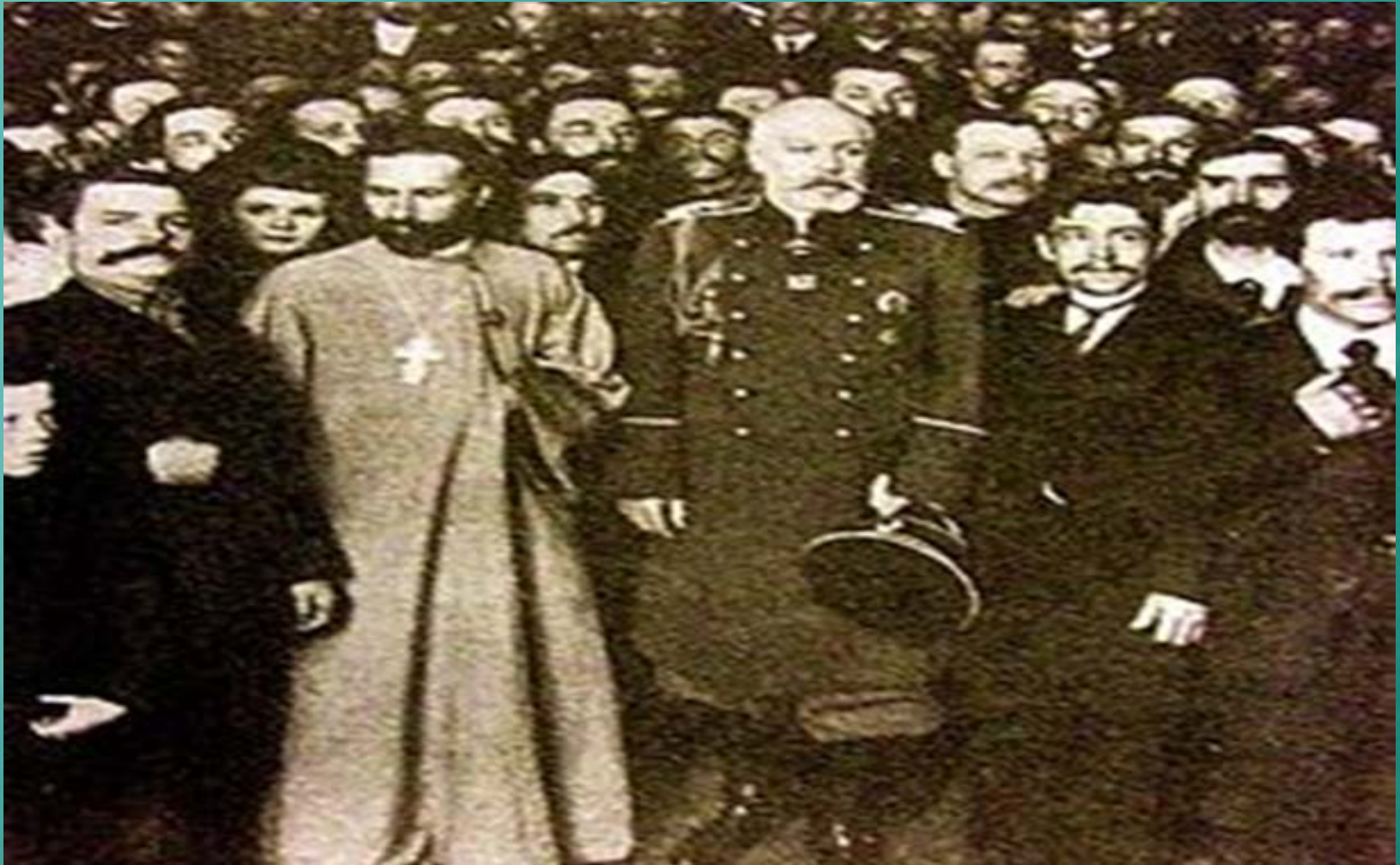
Г. А. Гапон и И. А. Фуллон на открытии Коломенского отдела «Собрания русских фабрично-заводских рабочих г. Санкт-Петербурга». Осень 1904 года