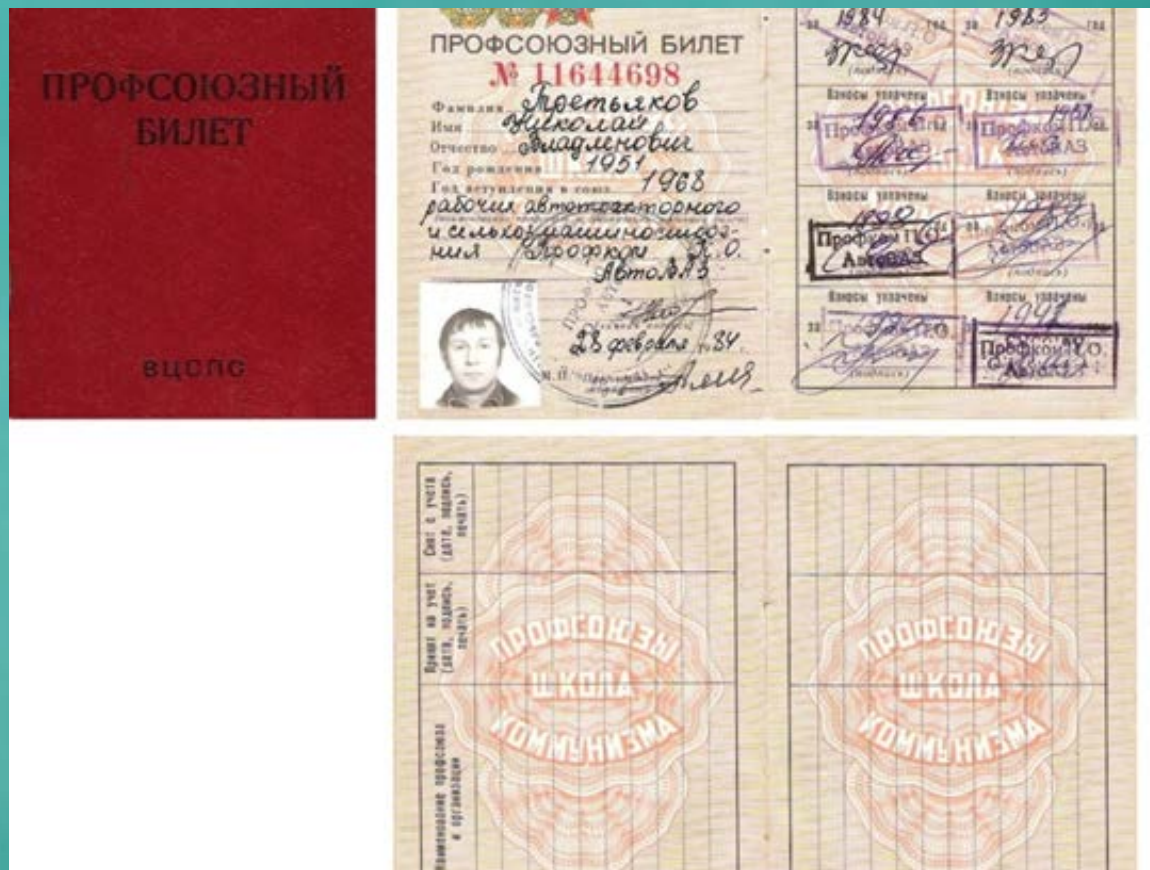
Профсоюзный билет члена ВЦСПС «Профсоюзы - школа коммунизма»